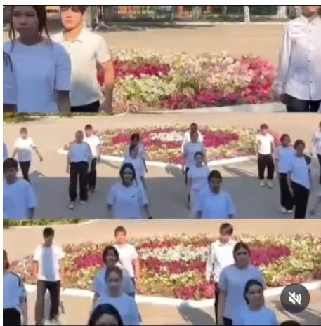
07.10.2025 Заседание «Клуба мальчиков»